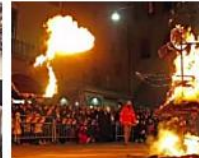
La befana in centro a Ferrara