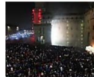
L'incendio del Castello Estense a Ferrara fa centro