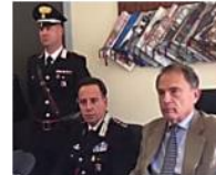
Duplice omicidio a Pontelangorino. Il video integrale della...