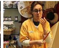
"Così ho fatto fuggire il rapinatore"